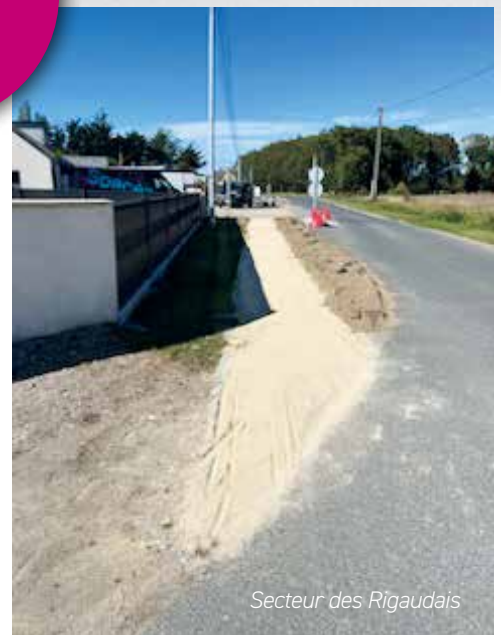
Secteur des Rigaudais

2021 : 16 980 • 2022 : 17 638 • 2023 : 28600