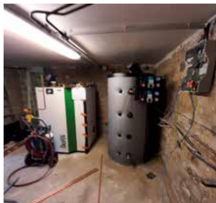
Système chaudière à pellets