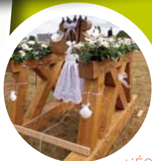
L'ÉCHO LOISIRS P. 10 Les Compagnons de Saint-Jacques