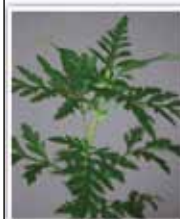
Photo d'ambrosie prise le 28 juillet 2016

L'ambrosie à feuille d'armoise poursuit son développement végétatif.