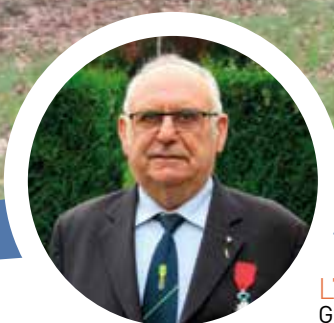
L'ÉCHO ZOOM P. 11 Guillaume GLORO