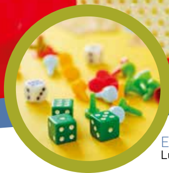
ECHO INTERCOMMUNAL P.7 Ludothèque