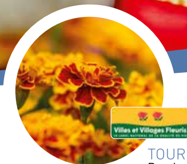
TOUR D'HORIZON P.4 Remise de la 2 ème fleur