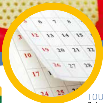
TOUR D'HORIZON P.5-6 Calendrier des fêtes