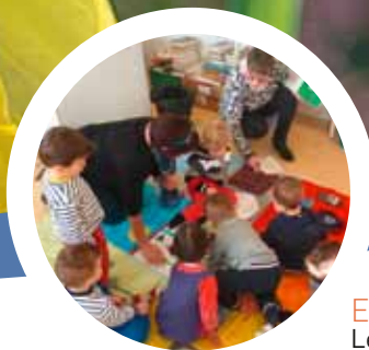
ECHO ENFANCE JEUNESSE P. 8 Le tapis lecture à la bibliothèque