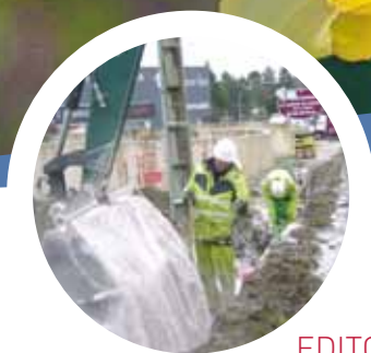
EDITO P. 2 Travaux rue de la Gaieté