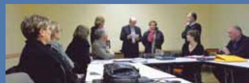
L'association des Compagnons de St Jacques remet le don validé lors du Conseil Municipal du 23 novembre 2015