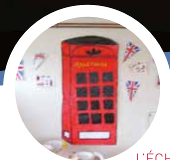
L'ÉCHO ENFANCE JEUNESSE P. 6 Restaurant Scolaire